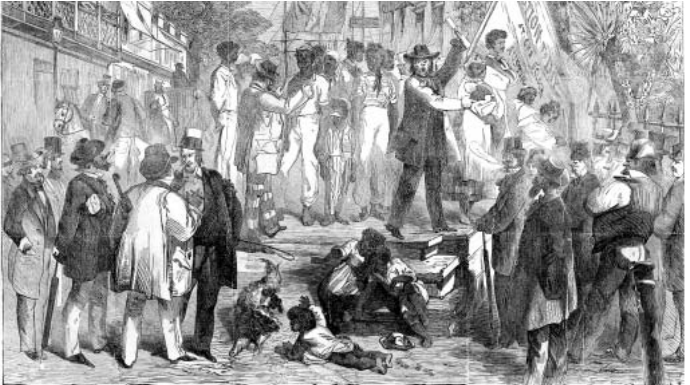
La major part d'esclaus trobaren el seu destí a Amèrica

ciudades sudanesas y de las sociedades suahilíes del este africano eran negros que, como intermediarios, desarrollaron una fuerte y cohesionada clase comercial que, eso sí es cierto, se islamizará profundamente.