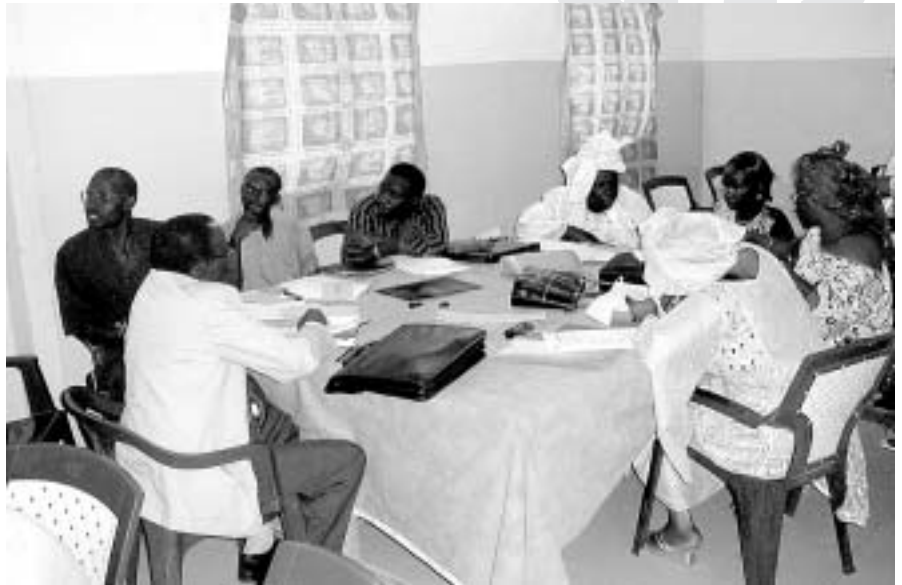
La transició del medi rural a l'urbà crea situacions noves a les quals els individus s'han d'adaptar sobre la marxa

La ciutat no guarda una morfologia pròpia de les ciutats. És a dir, hi ha construccions i noves edificacions, però són estranyes i massa costoses econòmicament. D'altra banda, les famílies amb recursos construeixen