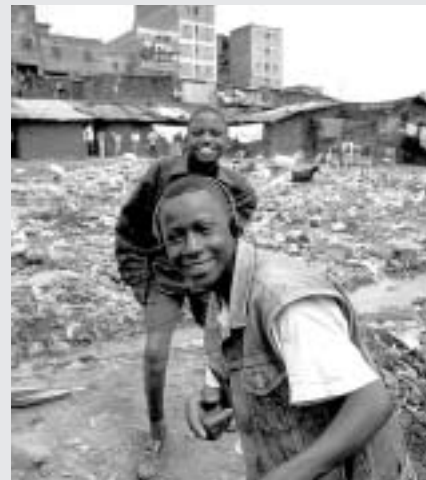
Els joves de Nairobi sobreviuen amb les seves pròpies lleis al marge de l'Estat

Metrópoli centenaria de tres millones de habitantes Nairobi es una de las ciudades más afectadas por la inseguridad en toda el África subsahariana. Según la prensa nacional, la sombra del Mungiki,