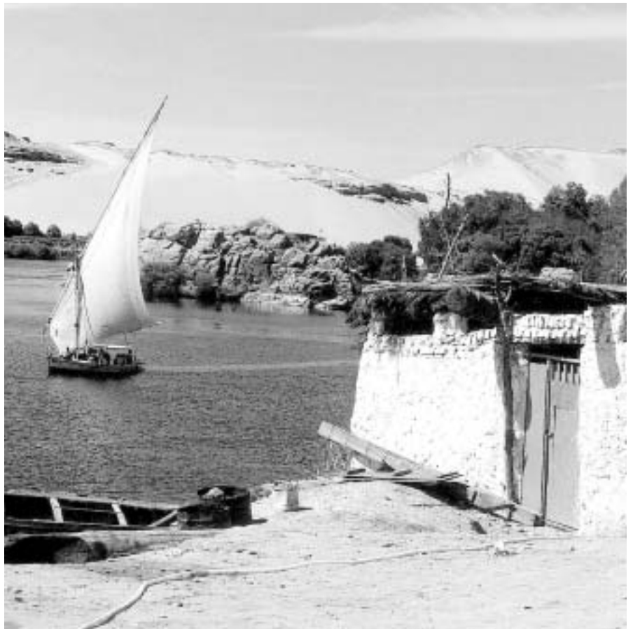
El riu Nil ha estat, històricament, la via de comunicació i desenvolupament més important de l'Àfrica oriental.

No es el caso del África occidental o zona de Guinea. Dos grandes obstáculos aislaban esta zona convirtiéndola en inaccesible para las civiliza-