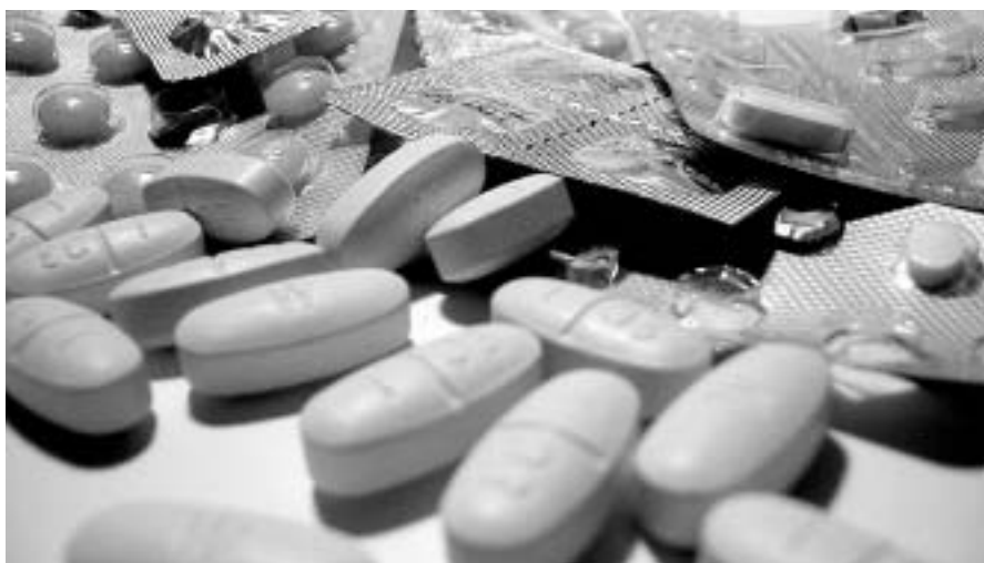
Els medicaments que ens sobren s'han de destruir adequadament i no poden ser enviats als països empobrits, fins i tot en situacions d'emergència

Des de l'any 2000 fins al desembre del 2002, diverses ONG sanitàries de l'Estat espanyol vàrem tirar endavant la campanya "Saber donar". Aquesta campanya, que s'ha estat desenvolupant paral·lelament a les que es duïen a terme a altres països europeus, com França, Holanda i Alemanya, tenia com a objectiu millorar i assegurar la qualitat de les donacions de medicaments realitzades cap als països empobrits atenent i seguint les directrius de