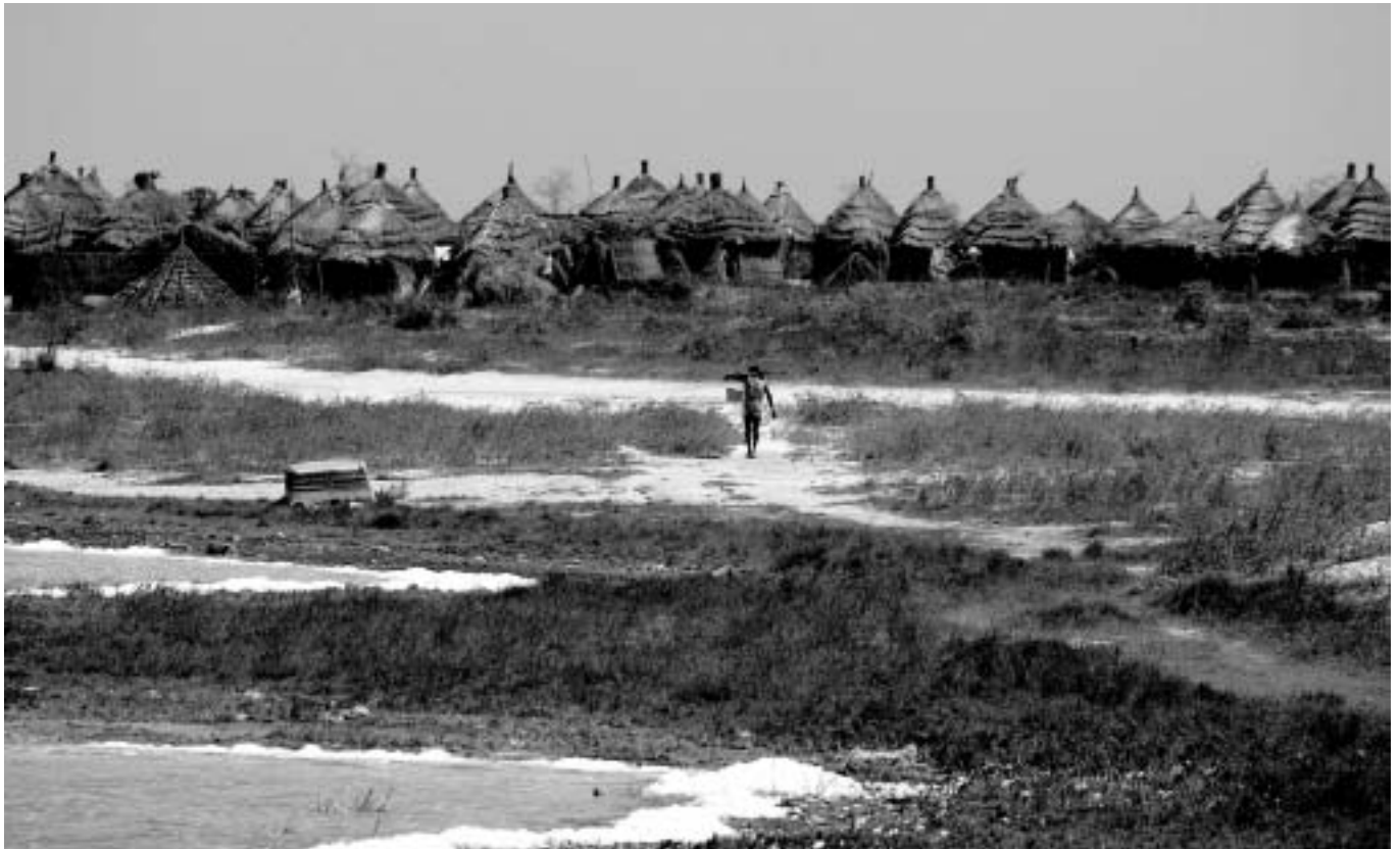
La cooperaci3n actual est3 marcada por una agresi3n econ3mica, una dominaci3n po3tica y un intento de sumisi3n cultural

ayuda internacional, hemos de resituar este mecanismo en su contexto global. Hemos de considerar la cooperaci3n dentro del contexto geopol3tico y cultural en el cual se sitúa y interactúa. Este contexto est3 marcado por una agresi3n econ3mica, una dominaci3n pol3tica y un intento de sumisi3n cultural, por parte de los poderes occidentales, es decir por parte de los gobiernos de los pa3ses ricos y de las firmas transnacionales (recordamos que las riquezas naturales africanas est3n en manos de firmas occidentales y los mercados de materias primas est3n controlados y manipulados desde el Norte).