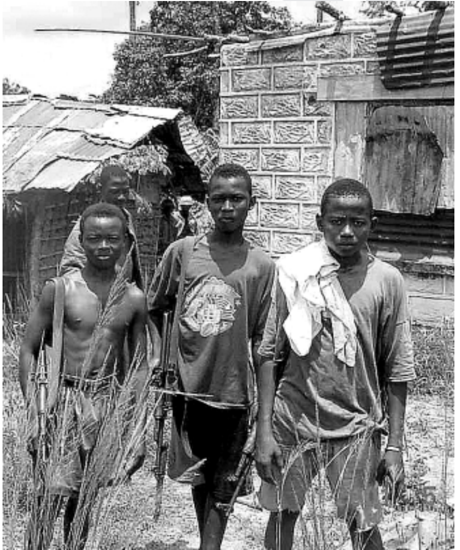
Nens soldat a Sierra Leone

En algunos lugares como Sierra Leona, el estado llegó al colapso y nuevos gestores de la violencia – los llamados señores de la guerra –, se apoderaron de zonas concretas para la explotación de los recursos mediante ejércitos de trabajadores servilizados. Las redes de comunicaciones sufrieron un retroceso acentuado con la aparición de aeropuertos que permitían la salida de minerales y productos sin necesitar enormes infraestructuras. Esta economía informal (diamantes, droga, armas) se pagaba directamente en especie y salía del control del estado formal. La desarticulación a favor de occidente alcanzó su nivel máximo - las empresas sustituyeron a los gobiernos anteriores, normalmente a tra-