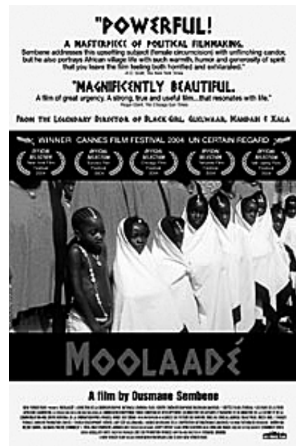
Mooladé , d'Ousmane Sembene

Pel que fa a la zona francòfona, a l'Àfrica occidental, els països amb un ci-