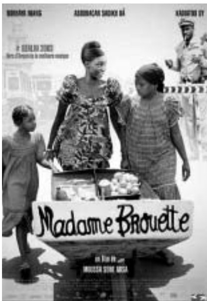
Madame Brouette , de Moussa Sene Absa

Yam Daabo , dirigida per Idrissa Ouedrigo, és una coproducció de Burkina Faso i França que aborda el desarrelament de les poblacions rurals, obliga-