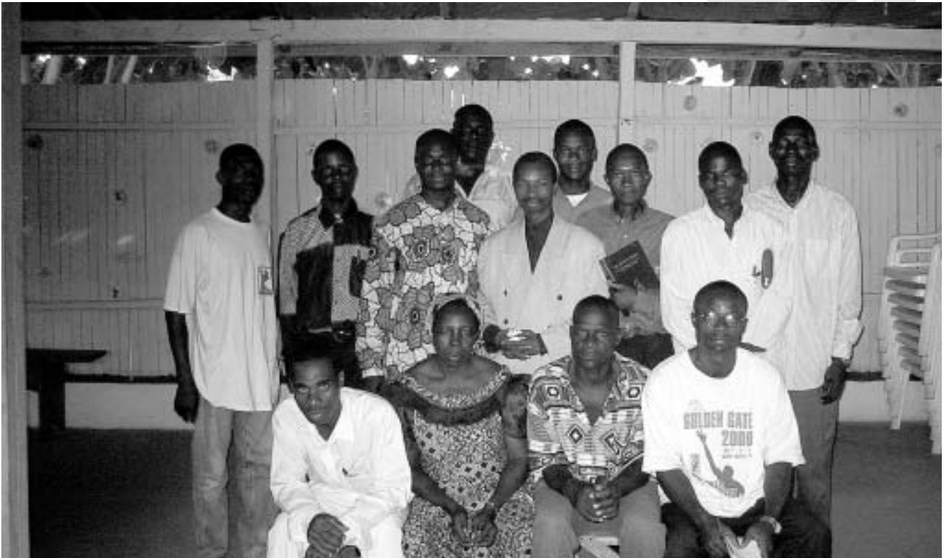
Les infraestructures són precàries i el continu assetjament rebel i militar complica els serveis.

La Delegació Akwaba està gestionant un programa de detecció i intervenció socio sanitària integral amb les mares seropositives i els seus fills en cinc centres de salut primària de Bouaké. L'objectiu d'aquesta campanya és reduir la proliferació de la sida entre la població més vulnerable. Els darrers dos anys de conflicte armat i la manca de serveis de detecció i prevenció han disparat les estadístiques de contaminació i transmissió de la sida, i en aquests moments és un dels factors més importants de mortalitat infantil i de les joves mares en edat de procreació.