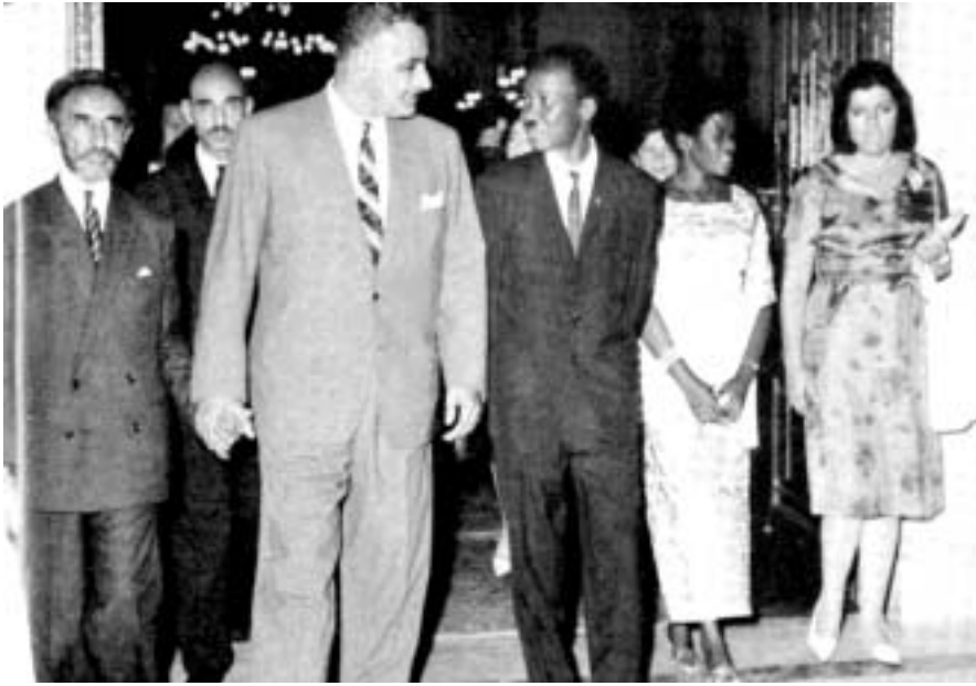
El president de Tanzània, Nyerere, a una trobada internacional a Egipte

todo, para defender los intereses y la seguridad de los misioneros y comerciantes).